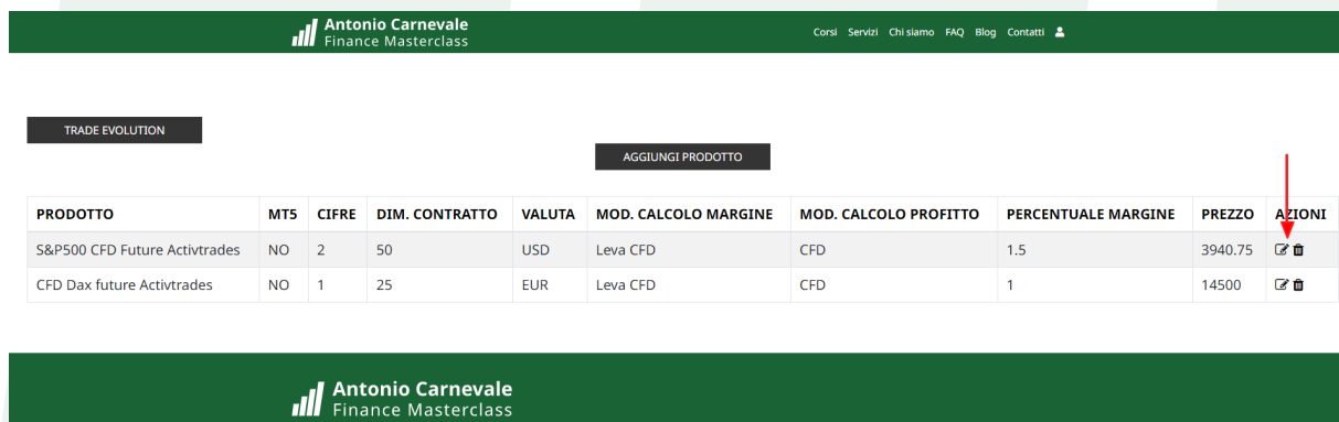
Figura 7 - Tabella riepilogativa dei prodotti CFD creati

Dopo aver inserito correttamente tutti i dati, puoi cliccare su Salva. Il prodotto sarà memorizzato e sarai reindirizzato alla schermata che elenca tutti i prodotti CFD che hai appena definito.