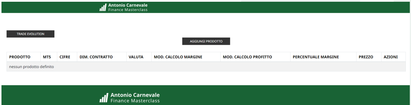
Figura 4 - La schermata per creare e gestire i prodotti CFD

In questa schermata potrai trovare, modificare o cancellare i prodotti CFD definiti manualmente, se presenti. Partendo da sinistra, in alto troviamo il pulsante per ritornare alla schermata operativa mentre in centro troviamo il pulsante che ci permette di definire un nuovo prodotto.